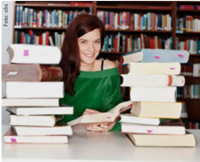
Zeitmanagement: Langwierige Projekte erfordern gute Planung.

Prioritäten setzen Ähnlich wichtig ist es, Aufgaben nach ihrer Dringlichkeit zu ordnen. Man überprüft: Geht das Seminar oder die Übung vor? Welche Literatur muss ich für mein Thema unbedingt gelesen haben, welche ist nur optional? Oder im Job: Kann ich Aufgaben delegieren, weil sie Nebensache oder Routine sind? Die absolut dringlichen, zielführenden Arbeiten stellen oft nur einen geringen Anteil im Alltag dar (Experten schätzen 15 Prozent); der große Rest sollte erst danach in Angriff genommen werden. Ein typischer Fehler, der Zeit „frisst“, ist übrigens der Versuch, mehrere Dinge gleichzeitig zu erledigen. Multi-Tasking-„Talente“ arbeiten nur scheinbar effektiv. Infos: www.seiwert.de .